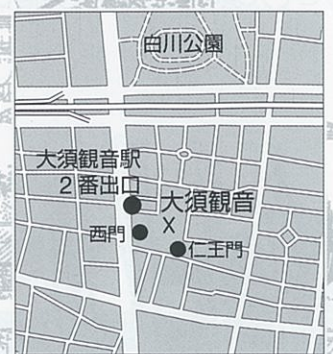
地下鉄鶴舞線大須観音駅2番出口すぐ